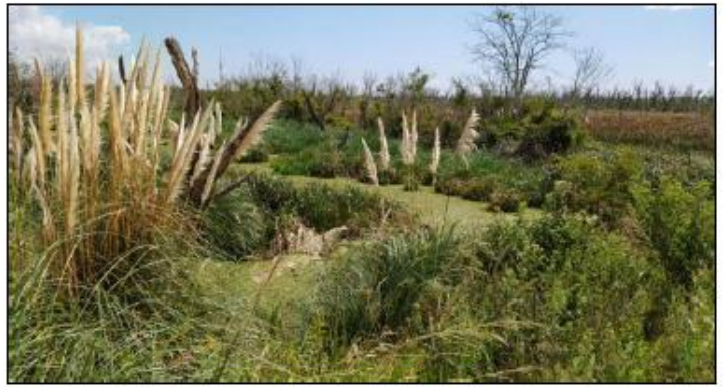
Fotografía 8: Canal Norte Calle 63 – Bosque muerto – Anegamiento