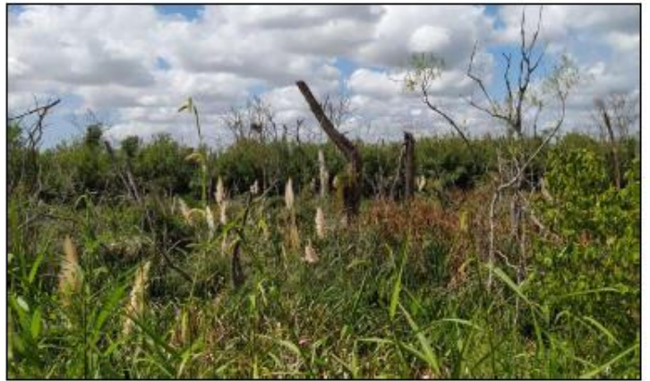
Fotografía 9: Canal Sur Calle 63 – Bosque muerto - Anegamiento