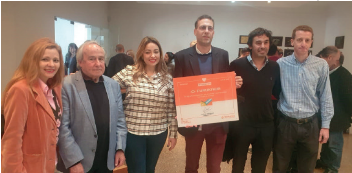
Los jóvenes integrantes de la conducción de la empresa instalada en la zona de El Pato, acompañados por el experimentado ingeniero que fomentó la instalación cuando todavía fabricaba con cobre. Hoy exportan a varios países latinoamericanos. (ver pág. 7)