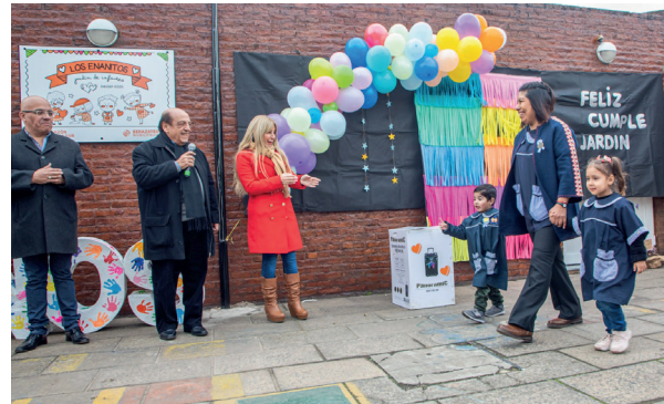
Los chicos inician el desfile ante funcionarios educativos y municipales (ver pág. 5)