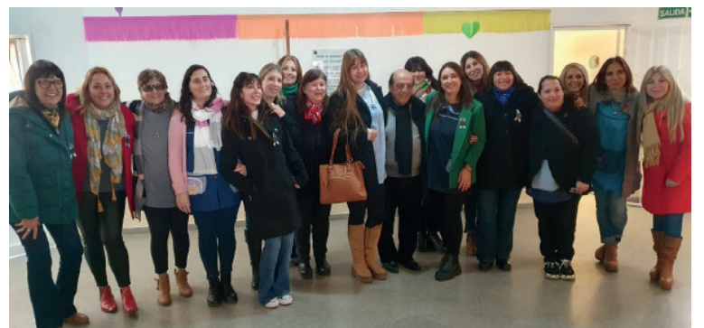
Docentes, de antes y actuales, con autoridades